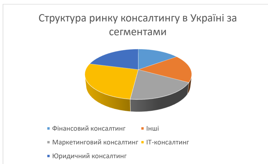
Рисунок 3.3 – Структура ринку консалтингу в Україні за сегментами

На рис. 3.3 зображено структуру ринку консалтингу в Україні за базовими компонентами. Отже можна описати головні компоненти ринку консалтингу України. Основні структурні фрагменти (рис. 3.3) найбільшу долю охоплює ІТ-консалтинг – 26%. Тобто, ІТ-консалтинг –являється лідером за рахунок, аутсорсингу, зусилля сповільнити затрати збору інформації фірмами, що заподіює передачу виконання ряду функцій стороннім виконувачам. Великим попитом користуються уведення інформативних систем та їх об'єднання за для підняття результативності управлінських процесів у бізнесі. Ця доля консультаційних послуг спрямована до переходу на розробки систематичних ІТ-проектів та мобільних технологій. Взагалі, сектор ІТ-консалтингу зараз займає найбільш високоприбуткову позицію.