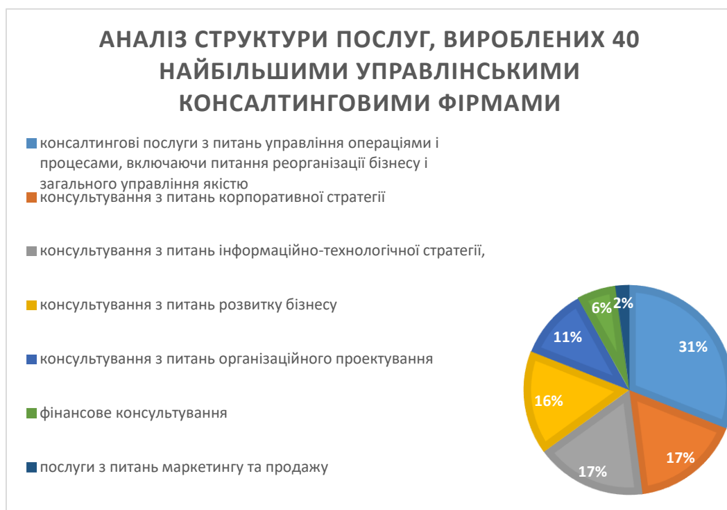
Рисунок 2.1 – Аналіз структури послуг, вироблених 40 найбільшими управлінськими консалтинговими фірмами.

За даними «New York Times», 15% компаній використовують послуги спеціалістів на постійній основі і 35% звертаються за допомогою консультантів по мірі необхідності.